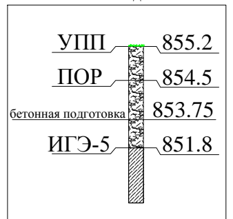
СКВ-2 за пределами котлована