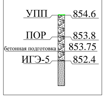
СКВ-6 в пределах котлована