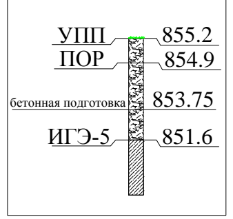
СКВ-3 в пределах котлована