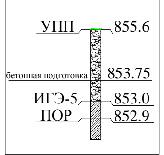
СКВ-5 на укосе котлована