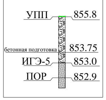
СКВ-9 в пределах котлована